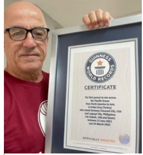
Erden Eruç'un 16, 17 ve 18. Guinness Rekor Sertifikaları Nisan ayında teslim edildi.