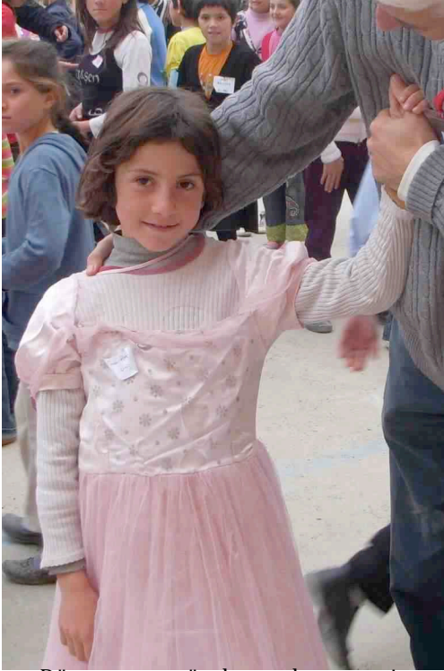
Dünyanın en güzel pamuk prensesi...