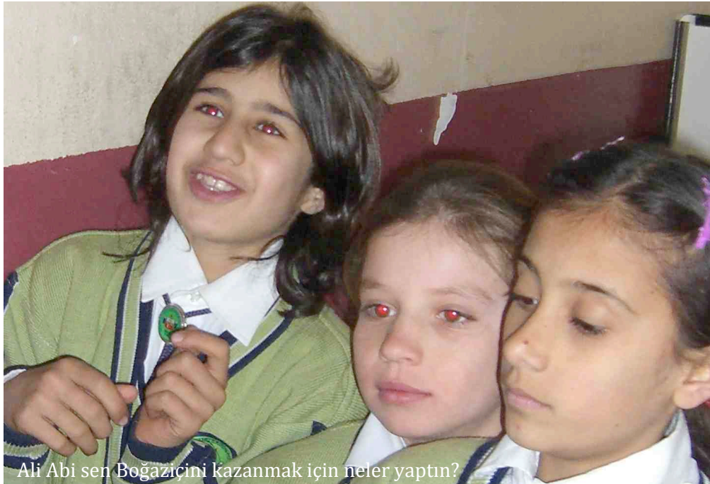
Ali Abi sen Boğaziçini kazanmak için neler yaptın?

Köyünde kalan... Hatta maalesef intihar da eden..."