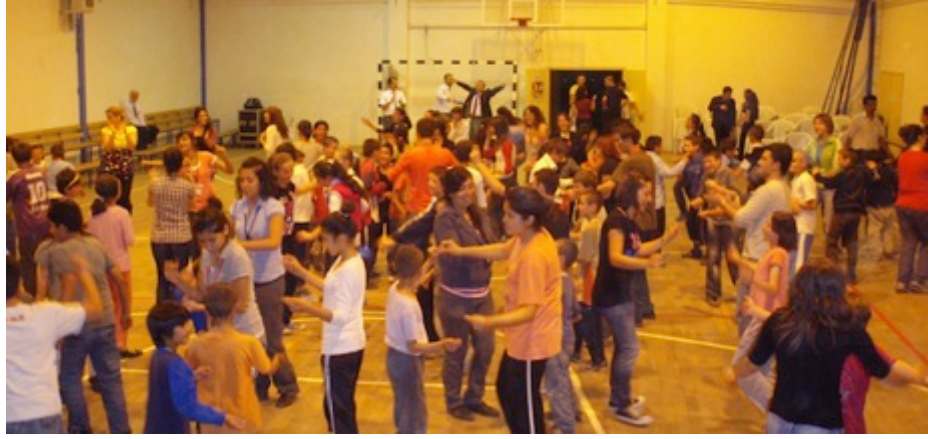
4. Günün sonu gece deneyleri, YBO'lu kardeşlerinin filmi ve sonunda eğlence... Oynamasını bilmeyenlerde bu neşe dolu ortama kendilerini bırakıyor, öğretmenleriyle, abileriyle, ablalarıyla oynuyor... "Bugün çok güzel bir gündü.."

Ama ne olursa olsun onlara bir şeyler öğrettiğimize eminim. Maalesef bu okulda daha kısa süre kalıp dönüş için çıkıyoruz yola.