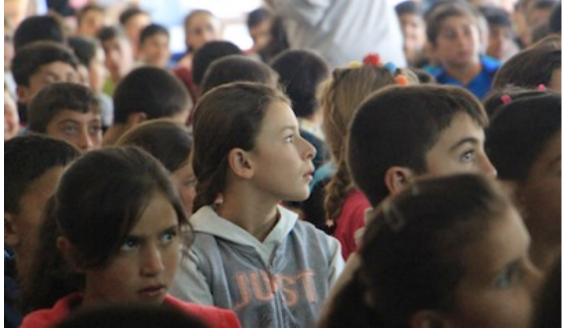
Resim 4. Birileri gelmiş, bir sürü abi abla, sadece bizim için geldiler, bizim için... Bunun anlamını merakla, heyecanla, sabırsızlıkla bekleyen gözlerde görebilirsiniz... Hayır hayır, bunlar göl kıyısında balık yemeye gelmemişler...