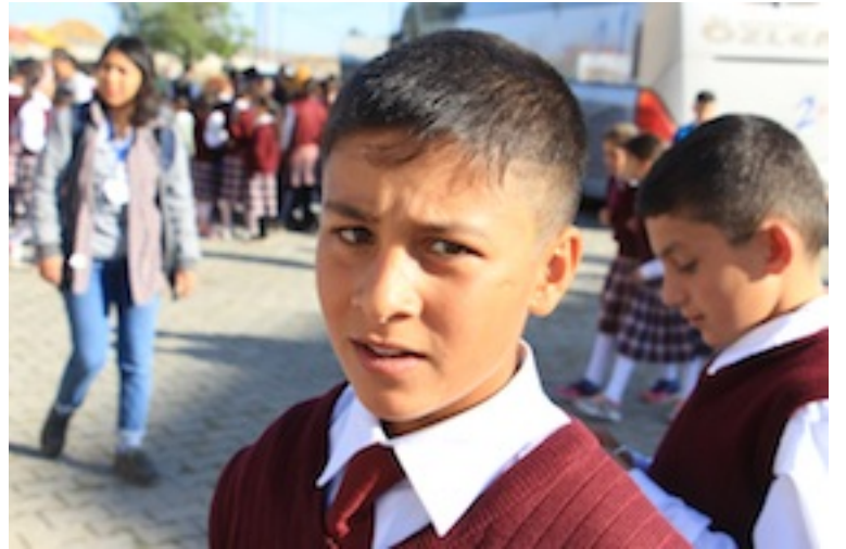
Resim 8. Dünyada sorunlar ne zaman ortadan kalkar, insanın doğduğu coğrafya kaderini belirlemezse... Bu güzel çocuklarımızın önünde tüm kanallar açık olabilmeli... Şimdilerde uzaktaki ilk yar'larımızın daha çok şansı var gibi çünkü teknolojinin etkisini daha az hissediyorlar...