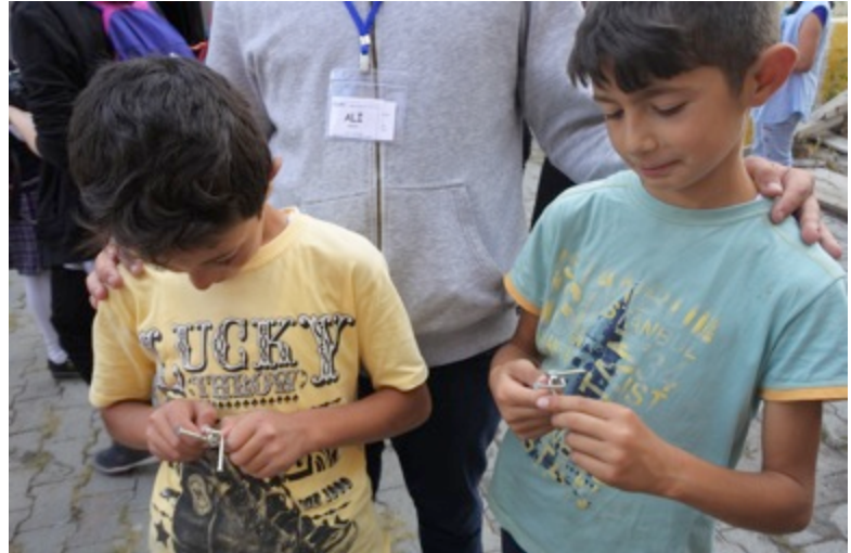
Resim 1. İlkyar projeleri birbirinin tekrarı, ama proje her defasında bambaşka seyrediyor, çünkü güzel çocuklarımız farklı, gönüllülerimiz farklı... Çiviler ellerde, "gerçekten çıkar mı bu Ali Abi?".

yanağını okşayacak, kollarım sımsıkı sarılacak, gönlüm kendini ısıtacak bir çocuk arıyordu etrafta ama hiç çocuk yoktu. Okul yok diye gelmemişlerdi daha. 17 saatlik