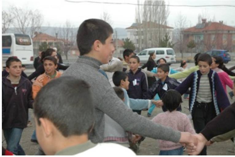
Resim 1. Güne sabah jimnastiği ile başlıyoruz... İçeride kahvaltı sonrası yemekhane temizleniyor, masalar çekiliyor, sandalyeler sıralanıyor... Hep beraber yeni bir güne hazırlanıyoruz...

Önce ismini sordum sonra ne olmak istediğini Türkçe öğretmeni olmak istiyorum dedi. Sonra her yemekte ya da konferansta gözleriyle beni arayıp sonra beni görünce abla gel sana yer ayırdım diye sesleniyordu. Yemek yerken sohbet ediyoruz. Sonra birden durdu “abla benim adım ne?” dedi.