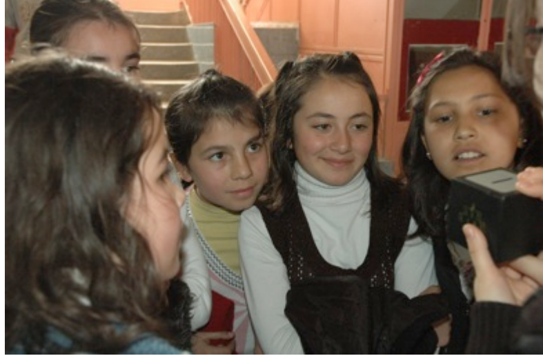
Resim 2. Her an yeni bir şey görmelerini arzu ediyoruz, koridor deneylerinde de, her gönüllü farklı bir deney, farklı bir bulmaca alıp çocukların karşısına çıkıyor: ilgi, sevgi, masumiyet hepsi ayrı ayrı gözlere yerleşmiş... Hepsini çok özleyiyor ve seviyoruz...