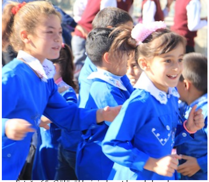
Fotoğraf 5. Gülücüklerinin hayat boyu kalıcı olması en büyük dileğimiz

Müziğin sesini duyar duymaz içimizde kıpırtılar başlamıştı. Çocuklarla birlikte hepimiz kendimizi ortamın o eşsiz ruhuna bıraktık. Kısacası çocukların eğlendiğini görmek, onların mutluluklarını görmek bambaşka bir duyguydu. Eğlenceden sonra projenin benim için en buruk geçen anı gelip çatmıştı: Vedalaşmak. Bu hepimiz için çok üzücü geçti. Çocuklardan ayrılmak onlara sırtımızı dönmek gerçekten çok zordu. Çocukların bize sınıksız sarılıp gitmemizi istememelerini ve bizim duygu dolu anlar yaşamamızı şöyle yorumluyordum: Demek ki aramızda güzel bağlar kurabildik ve onlarda bir günlük bile olsa güzel izler bırakabildik. Aynı zamanda onlardan çok şey öğrendim. Evet öğrendim artık hayattaki şu meşhur kavramın (MUTLULULUK) nerde saklı olduğunu. Ve anladım ki mutluluk denilen şey insanların gözlerinde umut ışığı, yüzlerinde bir gülümsemeye, onların mutlu olmasına vesile olmuştuk.