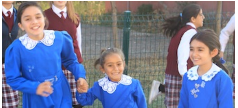
Fotoğraf 7. Çivilerin ardından sabah sporu başlıyor, vücutlar esniyor, dudaklarımızı çevreleyen kaslar da gevşiyor, sürekli gülüyoruz