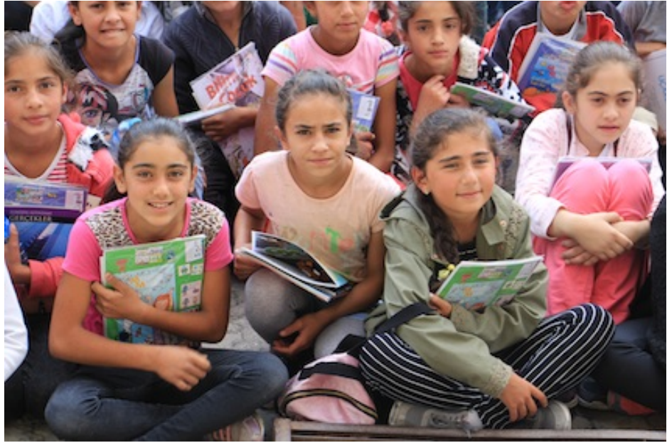
Fotoğraf 1. Onları ne kadar sevdiğimizi ve ne kadar zlediğimizi bilebilseler keřke. Acaba řimdi ne yapıyorlar, havalar ne kadar da soğumuřtur oralarda... Umarız hastalıklar uzak duruyordur ocuklardan... Mektupları ne zaman gelecek acaba?

Kendi iimde bu mcadeleyi verdiğim bir sırada beni heyecandıran bir haber duydum: İlkyar'ın Eylül Projesi. Daha nce uzun bir projeye katılmadığım iin farklı bir řey olmalı diye dřndm ve ok gemeden bu