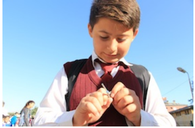
Fotoğraf 2. Gün her zaman çivi ile başlar... Çivi tanışmanın sadece ilk adımı değil; “zorla güzellik olmaz” dan başlar, “ben de yapabiliyorum” a uzar...

diye sorular yöneltiyordum. Gelen cevaplar genel itibariyle doğrudu: Evet bu çiviler hayatta karşılaştığımız problemleri, engelleri sembolize ediyordu. Peki bu engellerle karşılaştığımızda çivileri açamamamızda olduğu gibi pes mi edecektik? Yoksa yılmadan, usanmadan, vazgeçmeden onların üstesinden mi gelecektik? Tabii ki hiçbir zaman yılmamalı, pes etmemeli ve vazgeçmemeliydik.