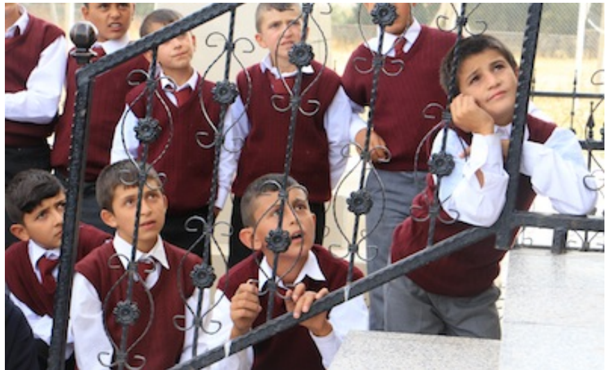
Fotoğraf 3. Her zaman çok ilgili ve meraklılar, keşke hergün bugün gibi olsa.

Çivi etkinliğimizden sonra hepimiz sınıftaki etkinliklerimizin başına geçtik. Benim etkinliğim yaratıcı dramaydı. Çocukların çoğu dramanın ne olduğunu bilmemelerine rağmen etkinliklerde güzel ve