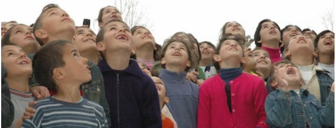
Resim 6. Güzel ilk yar'larımıza gülücüklerle dolu bir gün hediye etmek için yollarda ilkyar.

Önemli Not: İlk yar izlenimlerindeki ve resmi sitesindeki resimlerin izinsiz kullanılmadığını hatırlatır, göstereceğiniz hassasiyet için teşekkür ederiz.