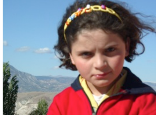
Resim 2: 1. sınıfta yatılı olmak, ne kadar zor. Köy dağda, çocuk da kalmadı, YİBO çare.

Okuma yazmayı 12 yaşında öğrenen bir çocuğun, çoban Hüseyin'in nasıl mücadele edip