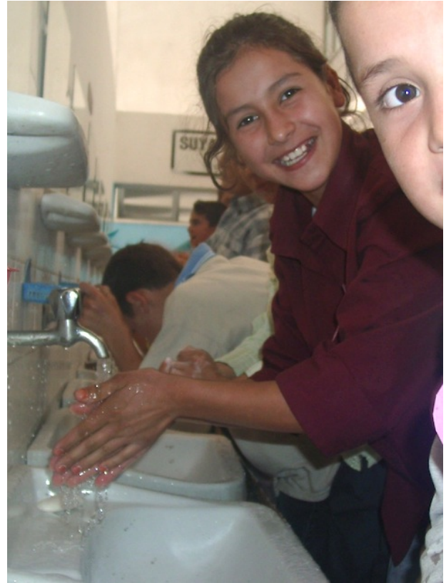
Resim 1: 520 kişilik planlanan eğik çatılı YİBO yemekhanesine girişte ve çıkışta eller yıkıyor, bir abla görüyor, sevgisinin en katıksız saf halini sunuyor; “iyi ki geldiniz”...

ama eğitimde fırsat eşitsizliğinin girdabından kurtulabilirlerse en iyi yerlere geleceklerinden hiçbir şüphem yok.