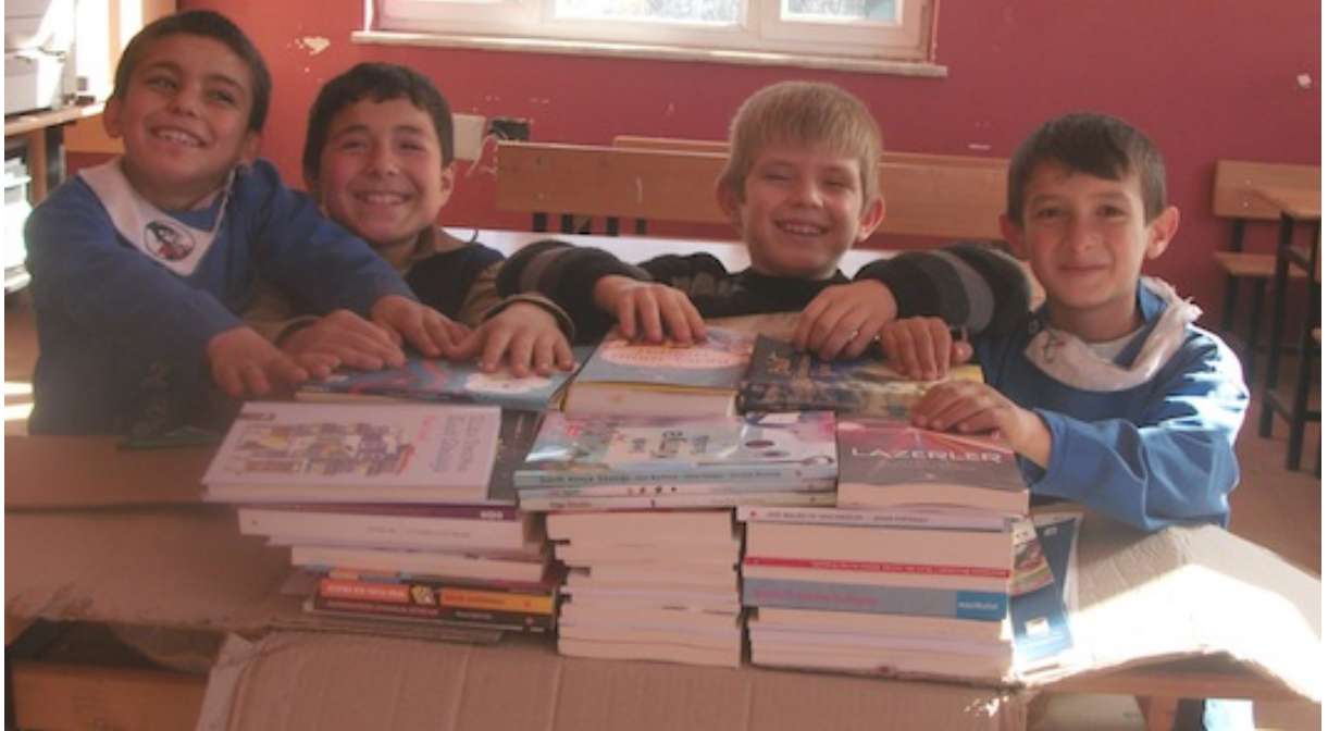
Resim 5: Onların gülümsemesini, meraklarını, okuma isteklerini besleyecek herşeye daha çok önem vermemiz ve bu yöndeki etkinlikleri arttırmamız gerek mez mi?

Siyaset Bilimi ve Kamu Yönetimi Bölümü Son Sınıf