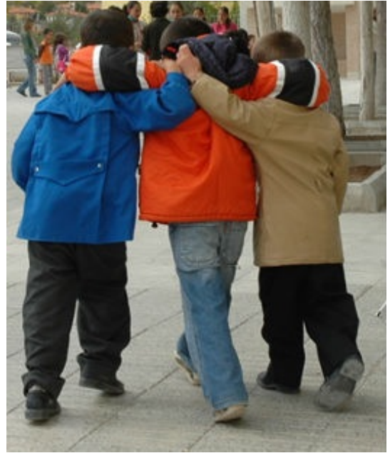
Resim 3 4: Özümüzdeki bu kadar güzelliğin büyüdüğümüzde kaybolmasına neden olan koşulları tekrar düşünmek zorundayız...