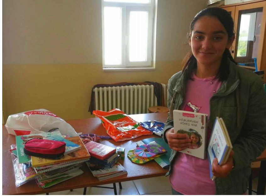
Hasangazi Ortaokulu Ulukışla/Niğde

*Etkinlik malzemelerinin içinde, kalemler, boyalar, defterler gibi kırtasiye malzemelerinin yanında; çeşitli oyunlar, Bilim Çocuk dergileri ve minik öğretmen ve öğrencilerinin yaşlarına uygun okuma kitapları bulunmaktadır.