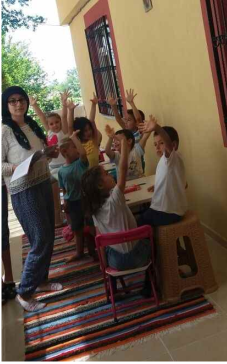
Kırlı Ortaokulu Perşembe/Ordu