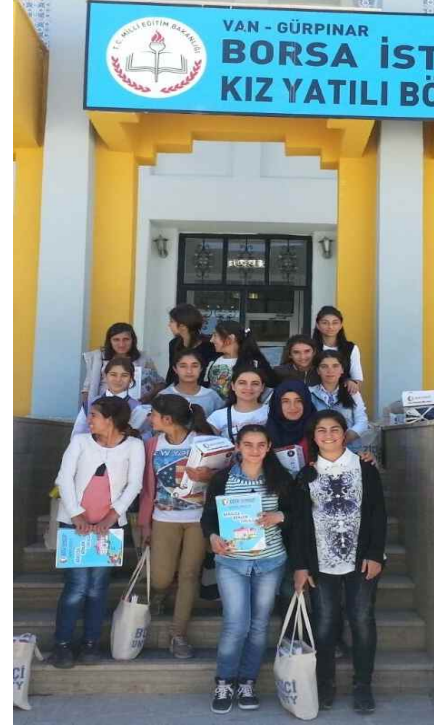
Borsa İstanbul YBO Gürpınar/Van